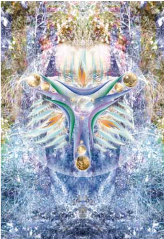
Dna-frequentie 'Authenticiteit' - ©WZ 2010

Zo zijn we in een soort wurggreep terecht gekomen waarbij het normaal is dat ik jou macht geef en jij mij macht geeft, terwijl niemand ons meer leerde dat we soeverein zijn over onze eigen werkelijkheid. Zoals we allemaal inmiddels kunnen zien heeft dit in zijn extreme vervorming geleid tot o.a. hebzucht, hoogmoed en machtsverslaving. En zoals we allemaal inmiddels ook kunnen zien, verlangen we naar iets anders en zijn we druk bezig deze oude structuren van ons af te werpen.