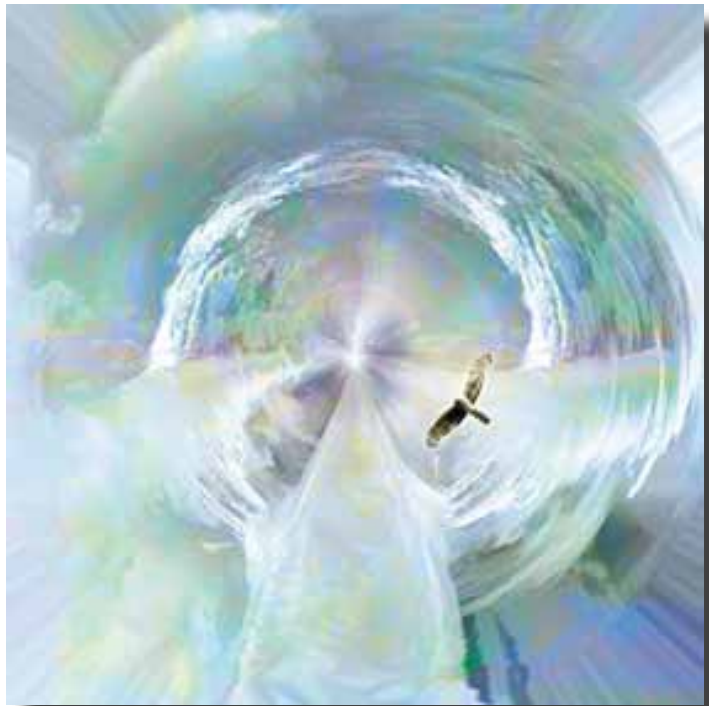
Trusting (Rebirth - Surfing 20120), © WZ 2011

We leven in stormachtige tijden en dat is beslist niet altijd even gemakkelijk, maar het brengt wel heel veel in beweging. Al die zekerheden die we dachten te hebben opgebouwd, blijken gestoeld te zijn op hele wankel begrippen zoals het idee dat ik voor een ander zou kunnen weten wat goed voor die persoon is, en vice versa dat een ander verantwoordelijk is voor mijn geluk en welzijn.