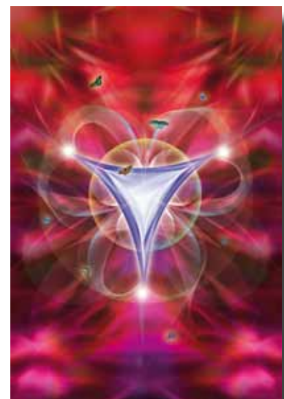
Geboorte, © WZ, 2010

In deze baarmoeder van de wereld, die zowel binnen als buiten ons aanwezig is, worden nu nieuwe blauwdrukken voor schepping gecreëerd, vanuit het bewustzijn dat verbonden is met de Eenheid der dingen, in plaats van strikt gericht op de afgescheidenheid der dingen. Een bewustzijn dat wij zelf hebben ontwikkeld en nu onze wereld binnen brengen. Het is alsof vanuit het Veld buiten ruimte en tijd, onze toekomstige zelden naar ons uitreiken en ons inspireren om contact te maken met deze nieuwe frequenties voor de Nieuwe Mens en de Nieuwe Aarde.