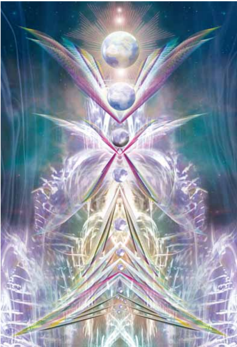
'The Divine Masculine', © WZ, 200

Hoe die wereld er dan concreet zal gaan uitzien kunnen we ons waarschijnlijk nog nauwelijks voorstellen, aangezien ons voorstellingsvermogen toch vooral gebruik maakt van wat het al kent. Maar als we ons van binnen en buiten blijven verbinden met die nieuwe frequenties van schepping die ons roepen, zal het Universum zeker zorgen voor de details, zoals Willem de Ridder ons in zijn Spiegellogie al zo glashelder heeft uitgelegd.